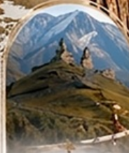
คาสเบกี 4WD EXPERIENCE