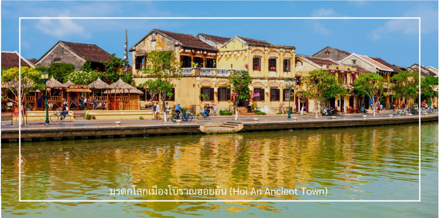
มรดกโลกเมืองโบราณฮอยอัน (Hoi An Ancient Town)

สมควรแก่เวลานำท่านสัมผัสประสบการณ์น่าจดจำ ล่องเรือกระดัง เป็นกิจกรรมที่น่าสนใจและเป็นเอกลักษณ์ในเวียดนาม การล่องเรือกระดังจะพาท่านไปสัมผัสกับทัศนียภาพที่สวยงามของท้องน้ำและธรรมชาติรอบๆ ท่านจะได้เห็นวิถีชีวิตของชาวประมงท้องถิ่นและอาจมีโอกาสดำลองทำกิจกรรมต่างๆ เช่น การจับปูหรือปลาในระหว่างการล่องเรือ นอกจากนี้ การล่องเรือกระดังยังเป็นการสร้างประสบการณ์ที่สนุกสนานและน่าจดจำ รวมถึงเป็นโอกาสดีในการถ่ายภาพกับทิวทัศน์ธรรมชาติที่สวยงาม