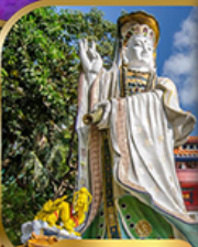
เจ้าแม่กวนอิม รับลิสสมัย