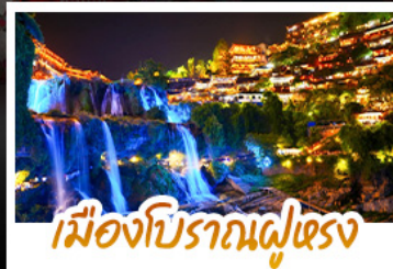
เมืองโบราณฝูเฉวง