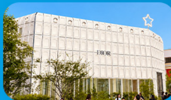
บรูกลินเกาหลี่