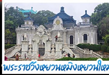
พระราชวังเฉวหนเหมิงเฉวหนิใหม่