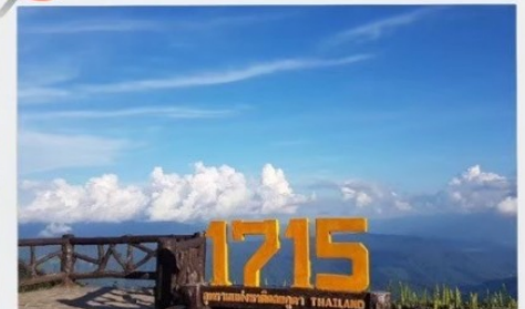
จุดชมวิวที่มีความสูง 1715