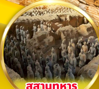
สุสานทหารดินเผาจีนซี