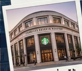
สตาร์บัคเซี่ยงไฮ้