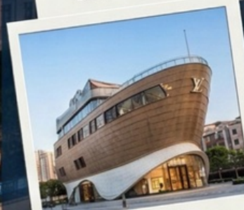
เข็ควินเรือหลุยส์วิทอง