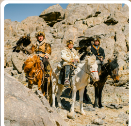
ชนเผ่ามองโก