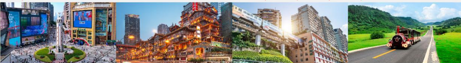
ถนนเจี๋ยฟางเป่ย์