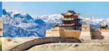
กำแพงเมืองจีน ด่านเจียอวิ่กวน

*ทางบริษัทฯ ขอสงวนสิทธิ์ในการสลับโปรแกรมทัวร์ตามความเหมาะสมขึ้นอยู่กับสถานการณ์หน้างาน โดยคำนึงถึงผลประโยชน์ของลูกค้าเป็นสำคัญ