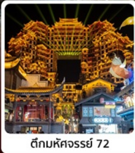
ตี๊กมหัศจรรย์ 72