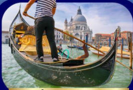
เที่ยวเกาะเวนิส