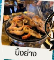
บั้งย่าง

อาหาร ครบทุกมื้อ อร่อยรส จนุก่อ ในทุกการเดินทาง