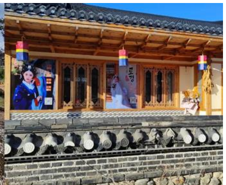
หมู่บ้านวัฒนธรรมเกาหลี