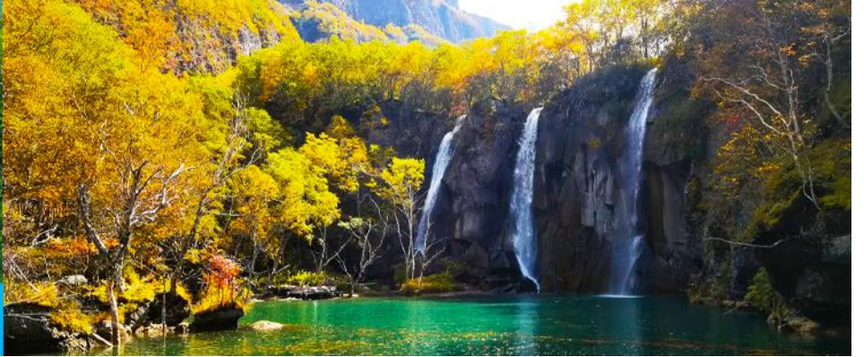
ละน้ำมรกต