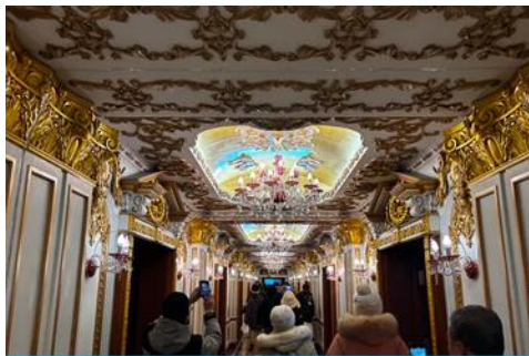
ตึกเภสัชกรรมฮาร์บิน

จากนั้นนำท่านเที่ยวชม ถนนจนงยังง 中央大街 ถนนสายหลักของเมืองฮาร์บิน ถนนที่เต็มไปด้วยอาคารบ้านเรือนที่เป็นสถาปัตยกรรมตะวันตกที่สร้างในช่วงคริสต์ศตวรรษที่ 18 – 19 ที่เมืองนี้ถูกปกครองโดยรัสเซีย อีกทั้งเป็นถนนคนเดินที่เป็นแหล่งรวมร้านค้าสินค้าแบรนด์เนมทั้งในและต่างประเทศ ร้านจำหน่ายของที่ระลึกและสินค้าพื้นเมือง ร้านอาหารพื้นเมืองต่าง ๆ มากมาย ให้ท่านมีเวลาอิสระเดินเที่ยวและช้อปปิ้ง หรือลิ้มรสอาหารพื้นเมืองตามอัชยาศัย.. **ให้ท่านลิ้มรสไอศกรีมชื่อดังเก่าแก่ของเมืองฮาร์บินท่านละ 1 ท่านฟรี