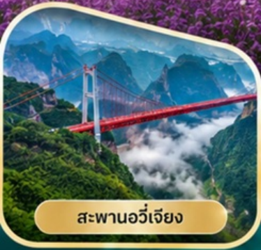
สะพานอวีเจียง