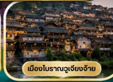
เมืองโบราณฉงเจียงจ้าย