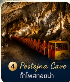
4 Postojna Cave ถ้ำโพสทอยน่า