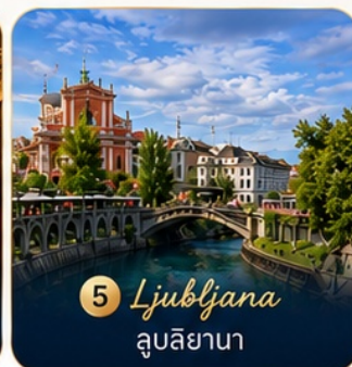
5 Ljubljana ลูบลิยานา