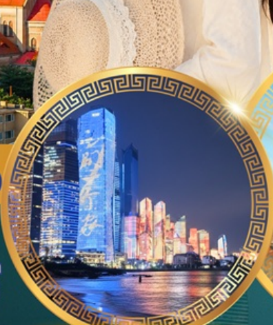
No.3 Bathing Beach

ลานจัดงานเบียร์ชิงเต่า Golden Beach ทางเดินไม้ริมทะเล ศาลเจ้าเทพทะเล ถนนคนเดินโตตง พิพิธภัณฑ์เทศบาลชิงเต่า สวนสาธารณะซิกแนลฮิลล์ ถนนหลงเจียงสู่ กระเช้าภูเขาไท่ผิง ยาน Da Bao island โบสถ์ st.Michael's Cathedral ถนนจงซาน ถนนคนเดินฟ้าย่าน จัตุรัสเมย์ไฟร์