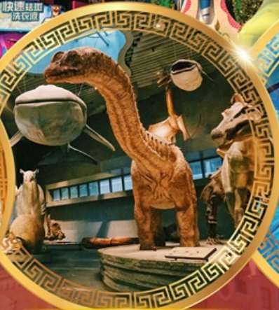
พิพิธภัณฑ์ธรรมชาติเซี่ยงไฮ้