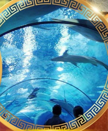
เซี่ยงไฮ้อาเซียนอะควาเรียม