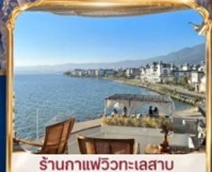
ร้านอาหารแพรวทะเลสาบ BAN SHAN YUE (รวมค่าเช่า ไม่รวมเครื่องดื่ม และค่าเช่าเสื้อผ้ารูป)