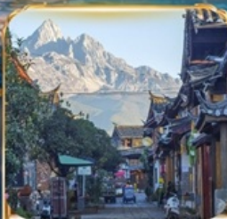
เมืองโบราณซูเหอ