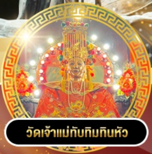
วัดเจ้าแม่กิมทิมทิว