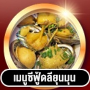
เมนูซีฟู้ดลิ้นจี่