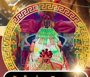
วัดเจ้าแม่กวนอิมสองอำ