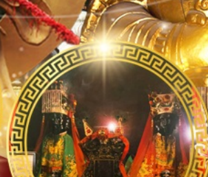
วัดบ้านโหมง