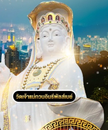
วัดเจ้าแม่กวนอิมรัฟาลัสโย