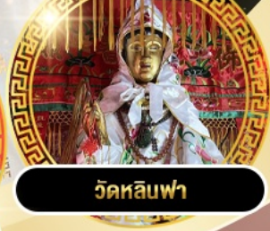
วัดหลิวฟา