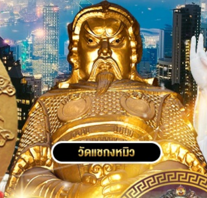
วัดเข่งหนิว