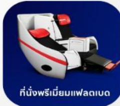
ที่นั่งพรีเมียมแพลนเบด