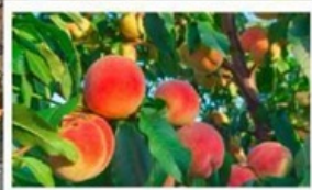
เก็บลูกพีชสด ๆ จากต้น