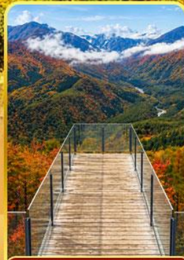
อาคุบะอิวาดากะ