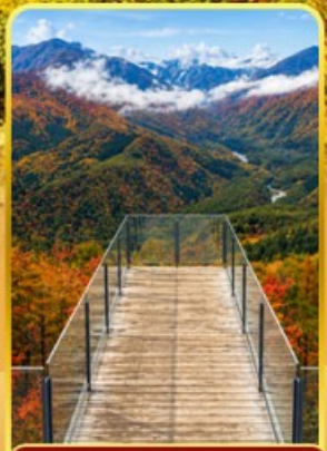
ฮาคุบะอิว่าตากะ