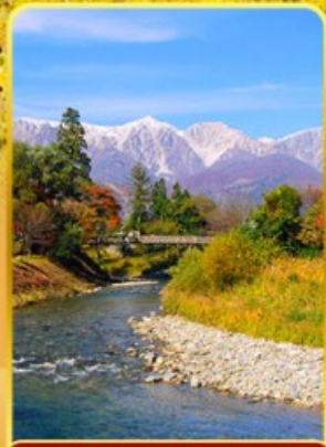
โออิเดะปาร์ค