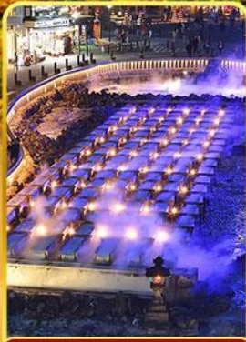
ชมยูบาตากะ