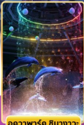
อควาพาร์ค ซินางาวะ