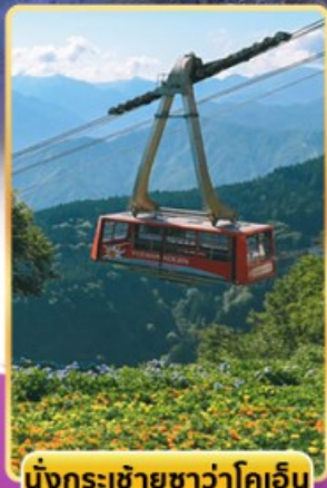
นั่งกระเช้าชูซาว่าโคเอ็น