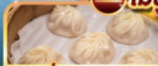
เสี่ยวหลงเป่า