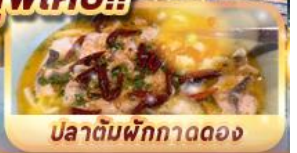
ปลาต้มผักทอดอง