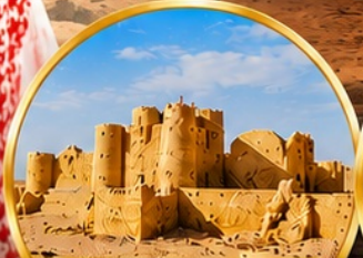
กลุ่มปราสาททะเลทราย (Desert Castles)