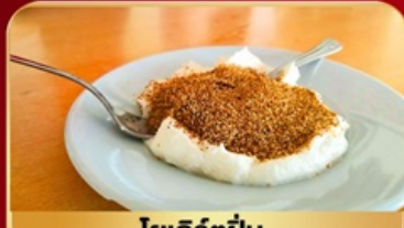
โยเกิร์ตผืน