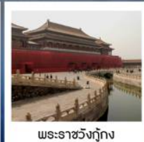
พระราชวังกรุงปักกิ่ง