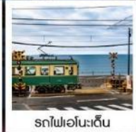
รถไฟโอโนะเด็น