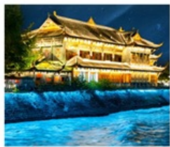
เมืองโบราณกวันเซียน