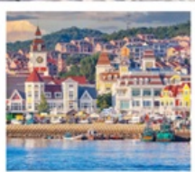
ท่าเรือประมงเหยียนโก๋

เรือลิววิส / ย่านฮั่นเล่อฟาง / ถนนฮั่วจวิปา ท่าเรือประมงเหยียนโก๋ / ย่านฮองโหว่ 1920 / ถนนโบราณเฉาหยาง หอคอยกาลเวลา / ชายหาดจินซา / รูปปั้นปลาวาฬ / หาดทรายซาจื่อโหว่ หาดไซเบอร์ NO.3 / โรงงานเบียร์ชิงเต่า / โบสถ์ St. Emil ถนนคนเดินไต้ตง / สะพานจันเฉียว / จัตุรัส 54 / ห้าง MIXC