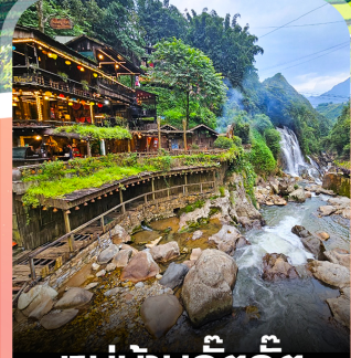
หมู่บ้านก๊วกก๊วก