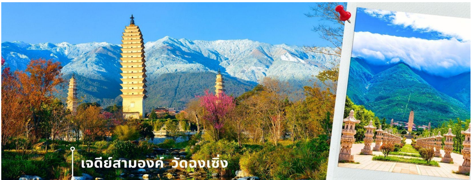
เจดีย์สามองค์ วัดหลงเซิ่ง

จากนั้นผ่านชม เจดีย์สามองค์ สัญลักษณ์ของเมืองต้าหลี่ ตั้งอยู่ภายใน วัดหลงเซิ่ง (Chongsheng Temple) วัดเก่าแก่ที่สร้างขึ้นเมื่อศตวรรษที่ 9 นับว่าเป็นหนึ่งในเจดีย์ที่สูงที่สุดในประเทศจีน อีกทั้งยังมีความศักดิ์สิทธิ์เป็นอย่างมาก ว่ากันว่าเป็นหนึ่งในสิ่งก่อสร้างเพียงไม่กี่แห่งที่ไม่ถูกทำลายจากเหตุการณ์แผ่นดินไหวในเมืองต้าหลี่เมื่อปี ค.ศ. 1925 จึงกลายเป็นสถานที่เคารพศรัทธาของชาวต้าหลี่เป็นอย่างมาก