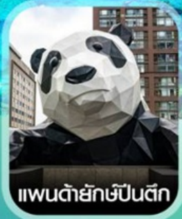
แพนด้ายักษ์ป็นตึก