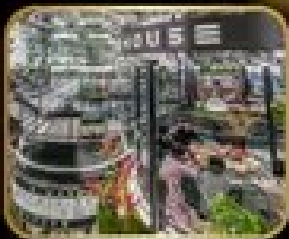
ภัตตาคาร เริ่มต้น WAREHOUSE NO.3