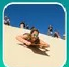
เฟื่องระย้าทะเลทรายที่หาดนันทนาการซิดนีย์