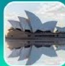
ซิดนีย์ โปสเตอร์ดำน้ำ