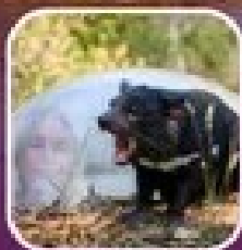
ชมสัตว์ในเขตรักษาพันธุ์สัตว์ป่า