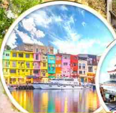
ท่าเรือสายรุ้ง