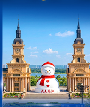
ตุ๊กตาหิมะยักษ์ ฮาร์บิน