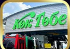
ซินโทกโทเบมวิอัลมาตี

นั่งกระเช้าชิมบุลัค • ทะเลสาบโคลโซ • ชารินเกรนด์แคเนยอน