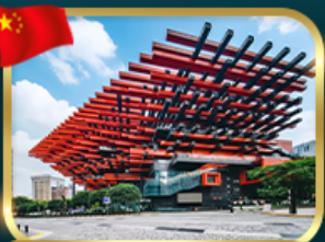
แลนด์มาร์กจั๊ว ตึกตะเกียบ