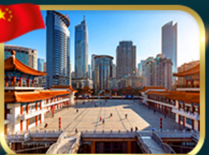
เขื่อนตึกไคว่ซิงไห่