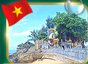
สักการะขอพรศาลเจ้ามังกร