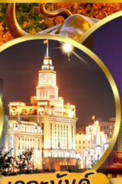
เดอะมันด์