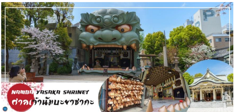
NAMBA YASAKA SHRINE

นำทุกท่านเข้คือนจุดถ่ายรูปที่ ศาลเจ้านัมมะยะซากะ (Namba Yasaka Shrine) ในย่านนัมมะยะของเมืองโอซาก้า ไฮไลท์ของศาลเจ้าแห่งนี้ คือรูปปั้นหน้าสิงโตอ้าปากขนาดใหญ่ ที่เชื่อกันว่า สามารถกลืนกินปีศาจร้ายหรือสิ่งไม่ดีทั้งหลาย ให้หายไป และนำพามาซึ่งความโชคดีให้แก่ผู้คน ปัจจุบันนักเรียนนักศึกษา และผู้ประกอบการธุรกิจนั้น นิยมมาขอพรให้ประสบความสำเร็จกันที่นี่ ด้วยความสูง 17 เมตร ความกว้าง 11 เมตร และความลึก 7 เมตร อีสระให้ทุกท่านสักการะ และเก็บภาพที่ ศาลเจ้านัมมะยะยะซากะ