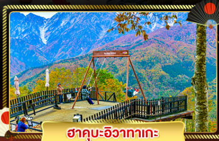
ฮาคุมะ:อิซากาเตะ