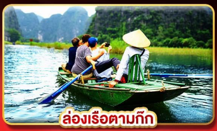
ล่องเรือตามกัก