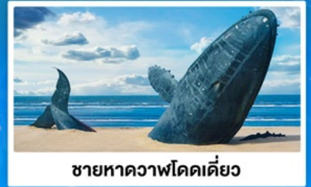
ชายหาดวาฬโดดเดี่ยว